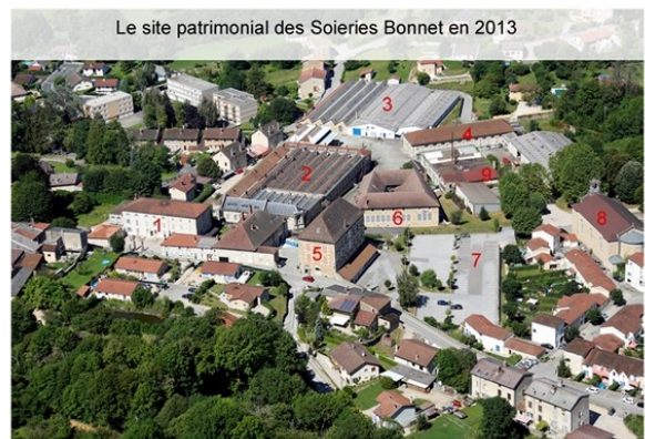
Le site patrimonial des Soieries Bonnet en 2013